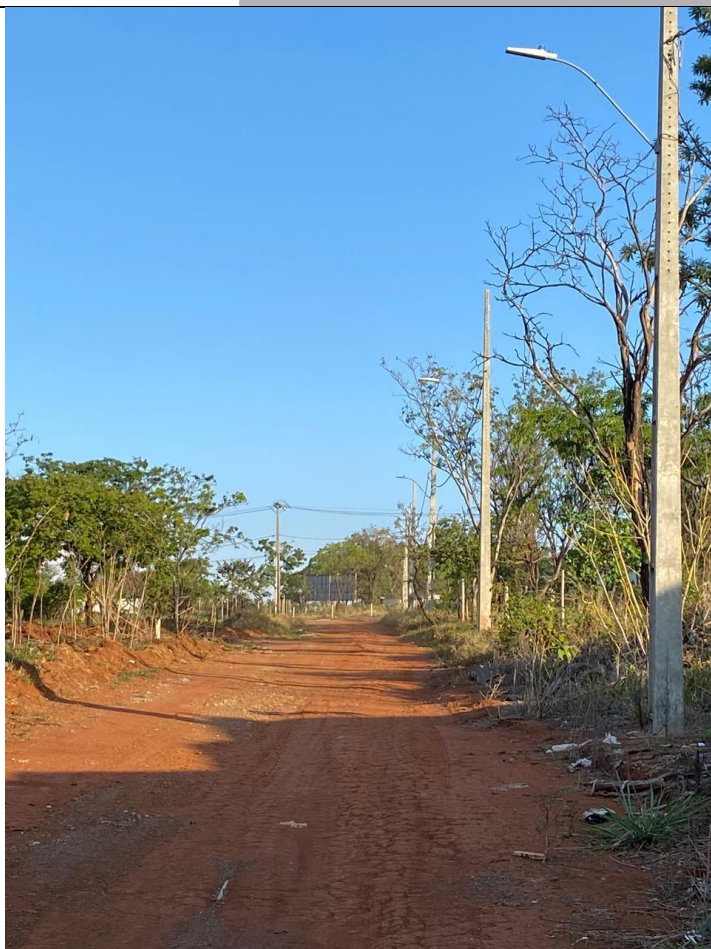
Descrição: Rua Ouro Preto